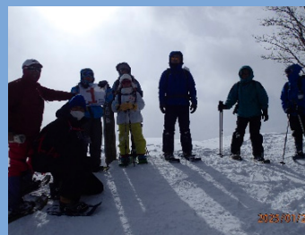
山頂での記念撮影