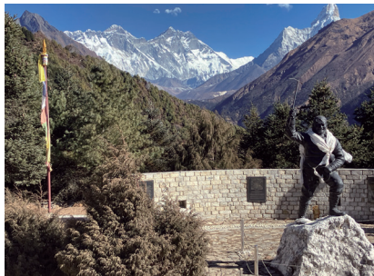
テンジン・ノルゲイ遺産センター前からのエベレスト