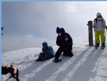
山頂での記念撮影