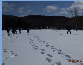
足跡のない湿原を歩いてみる