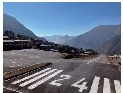
テンジンノルゲイルクラ空港