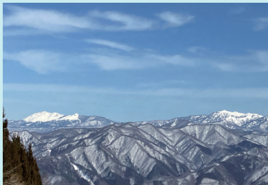
山頂付近から望む至仏山と上州武尊山（2月）

みなかみ町の中央に位置する大峰山と吾妻耶山。尾根筋を阿能川岳に延ばす谷川エリアの2つの名低山を縦走するコース。春4月のカタクリやスマレの花の頃からヤマモミジ、カエデやナナカマドが色づく紅葉シーズンまで、素晴らしい景色を見ながら山歩きが楽しめる。暖かい時期はヤマヒルに気を付けること。積雪期はノルン水上スキー場の第3リフトが乗車可能（登りのみ）なので、谷川や奥利根、武尊の雪山展望が楽しめる。