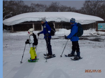
ビジターセンター前