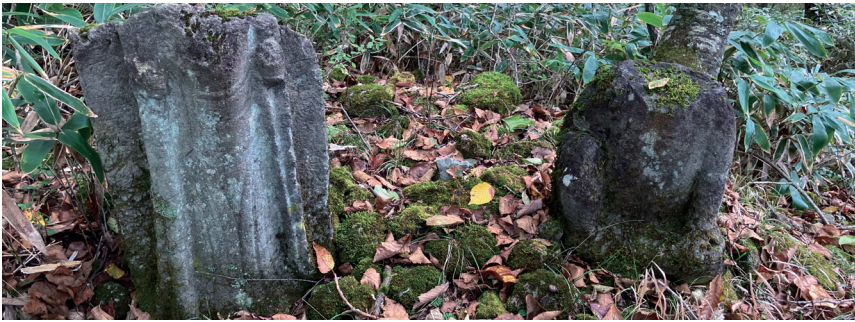
トレーニングでは三途の川の奪衣婆など赤城の地獄信仰の名残にも触れた。外輪山を登り上げた姥子峠で見つけた頭の無い2体の像が奪衣婆と思われる