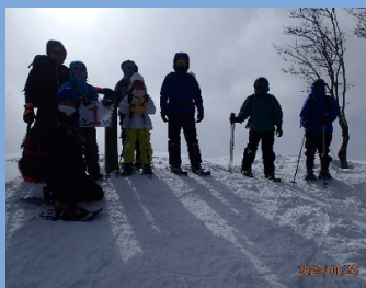
山頂での記念撮影