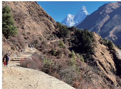
エベレスト街道からのアマ・ダブラム