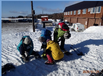
スノーシューの装着

例年より、極端に雪が多いためラッセルが深く（スノーシューを履いて膝位まで沈む）山頂まで行けるか心配だった。